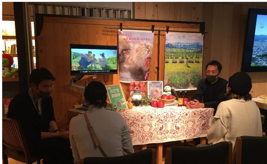
山ノ内町 のブース